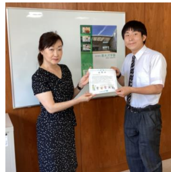
感謝状を受け取る様子